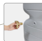
Robinet imitation laiton fourni